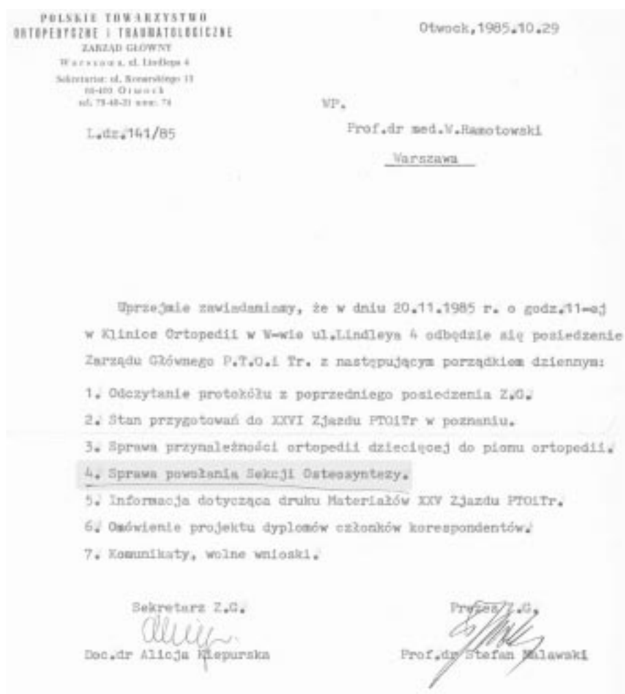
Ryc. 1. Decyzja Zarządu Głównego PTOiTr o powołaniu Sekcji Osteosyntezy Fig. 1. The Head Committee's decision to establish the Section of Osteosynthesis